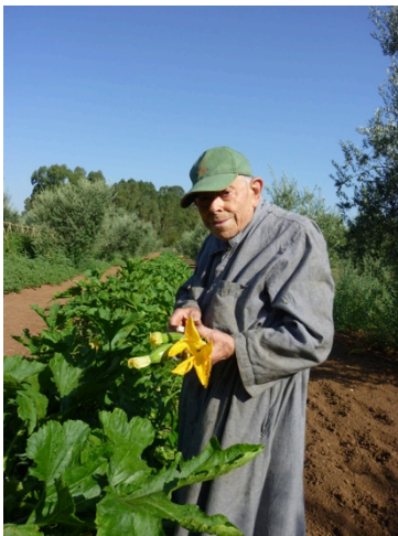
“In ipsis laboro certando”

Iniziamo questa cronaca estiva con un aggiornamento sulla nuova attività di cui vi avevamo già parlato: la vendita diretta di ortofrutta. Sono stati mesi davvero “caldi” in campagna... è proprio il caso di dirlo, sia dal punto di vista meteorologico - il che è normale - ma anche e soprattutto a causa del considerevole aumento sia del numero di clienti che dei metri di coltivazione. Per di più nel mese di agosto la comunità ha dovuto far fronte alle assenze per ferie di