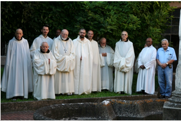
La comunità di Tre Fontane.

davvero commovente... e certamente apprezzato dagli ospiti convenuti per